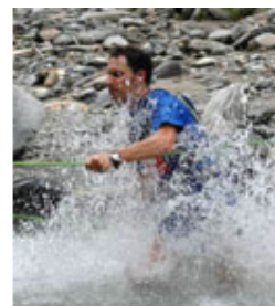
zum Vergleich: am 30.7.05

Die Schuhe bereits voll, kriegte ich kurz nach der Saltina noch die Schnauze voll: der steilste Anstieg des Tages, wenn auch nur kurz. Die kurze Kürze ist allerdings unverhältnismässig zur Winkelneigung des Neigungswinkels, drum ist es überhängend! Das Darben nach Finisher-Bieren wird noch grösser, aber nicht mehr für lange. Oben sieht man das Dorf Ried-Brig. Das Ziel ist so gut wie erreicht.