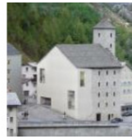
Der Stockalperturm in Gondo: gelungene Kombination historischer Bausubstanz und moderner Architektur nach dem Wiederaufbau

Ein paar Meter hinter der Ortstafel sieht man schon bald keinen Himmel mehr, so schmal wird die Schlucht. Das Tal scheint oben enger zu sein als unten. Eindeutiger Fall: beidseitig überhängend. Schlussendlich ist es völlig finster. Der Weg verläuft nämlich unterdessen im Berg, durch eine alte Armeebefestung. Hier warteten die eidgenössischen Weltkriegssoldaten, hoffend dem Mussolini eine vor den Latz brennen zu können.