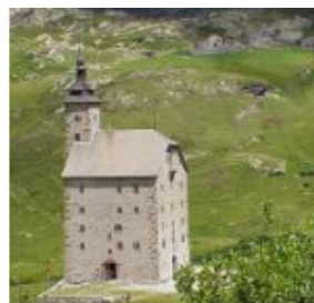
das Alte Hospiz (Barall-Hüüs) und das Alte Spittel (Stockalperturm) auf dem Simplon