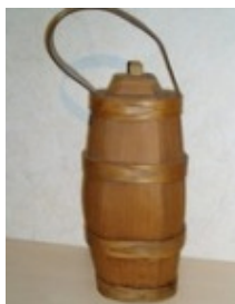
das Butili (von la bottiglia - ital. die Flasche)

An der oft heiteren Natur der Einheimischen können wir nun trefflich schlussfolgern, dass die Walliser sehr wohl wissen zum Butili Sorge zu tragen. Es regelmässig befüllen. Das Holz pflegen.