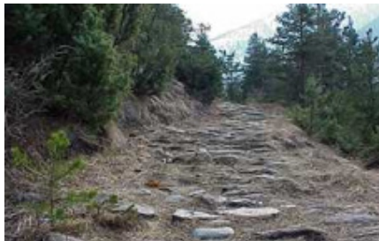
am Schallberg: "Der Berg ruft!"

Diese Gegend und die Ganter-Brücke kenne ich von früher, vom Motorradfahren. Aber damals, am Lenker festgebissen gab's keine Zeit für beschaulichte Seitenblicke. Reissen am Gaskabel und ständiger Kampf gegen Gravitation und Zentrifugalkraft verursachte – wie heute das Laufen – Schweissausbrüche, denn es war nicht immer eindeutig, wer Herr über den Schwerpunkt meines Böschungshobel bleiben würde: ich oder die Erdanziehung. Nur, damals war das Schwitzen mit erheblich weniger Anstrengung verbunden.