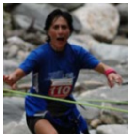
und stümperhaftes Vorgehen!...