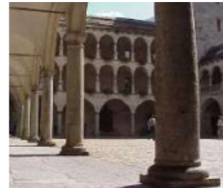
Stockalperpalast in Brig (der Gondo-Läufer kriegt ihn aber nur zu Gesicht, wenn er abends mit der Gattin nach Brig zum Shoppen muss!!!)

Bei der Fahnenstange auf der Simlpon Passhöhe ist noch längst nicht "Ende der Fahnenstange". Sehr wohl führt hier der Stockalperweg wieder ins Tal – nicht so der Gondo-Event. Letzterer weicht nämlich von Ersterem ab und steigt weiter auf abwechslungsreichen und schwierigen Single Trails. Durch unberührte Natur – wenn nicht drei, vier Blödmänner ihr Revier mit Pappbechern markierend, diese in die Geographie schmeissen tätén – ... durch fast unberührte Natur also, steigt der Weg auf 2661 Meter zum Bistinenpass.