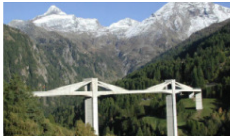
Ganter-Brigga: Sie gilt's zweimal zu "unterqueren", anstatt einfacher, kürzer und schneller zu überqueren, wofür sie eigentlich gebaut wurde.

Rothwald liegt schon ziemlich weit oben am Simplon und anstatt weiter zum Pass, geht es wieder tief in die Schlucht zur Taferna hinunter, da stossen wir von neuem auf den Stockalperweg. Kaum am Bach angekommen steigt es abermals und liederlich. Man staunt über die Säumer, die jahrhundertlang diesen Weg täglich – die Schmuggler nächtlich – mit ihrem Bagage zurücklegten.